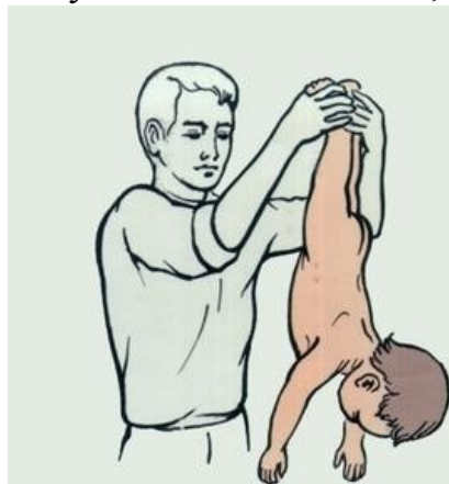
Рис.2.7. Удаление инородного тела из дыхательных путей ребенка

детей. Если ребенок вдохнул какой-нибудь мелкий предмет, попросите его покашлять резко, сильнее — иногда, таким образом, удастся вытолкнуть инородное тело из гортани. Или положите ребенка к себе на колени вниз головой и похлопайте по спине. Маленького ребенка попробуйте крепко взять за ноги и опустить вниз головой, тоже похлопывая по спине (рис.2.7).