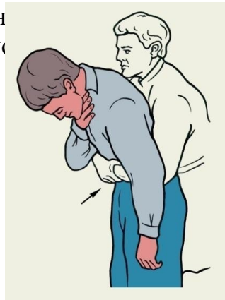
Рис.2.6.Удаление инородного тела из дыхательных путей

Прodelайте это, если понадобится, до четырех раз. Выдерживайте паузу после каждого нажатия и будьте готовы быстро удалить то, что может вылететь из дыхательного горла. Если кашель не прекратится, чередуйте четыре шлепка по спине и четыре нажатия па живот, пока не удастся удалить инородн живот по екращающемся кашле чередуйте толчки рукой в таньем по спине.